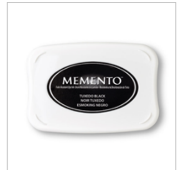
Tuxedo Black Memento Ink Pad