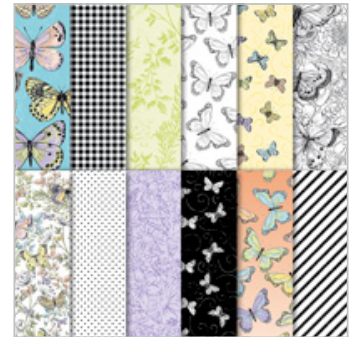
Botanical Butterfly Designer Series