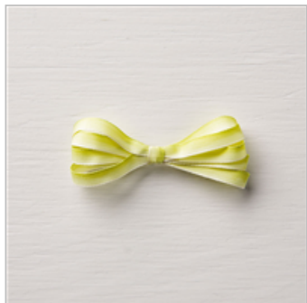
Lemon Lime Twist 1/4" Ombre Ribbon