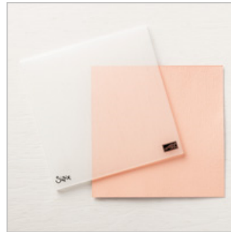
Subtle Dynamic Textured Impressions Embossing Folder