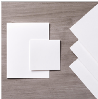
Whisper White 8-1/2" X 11" Thick Cardstock