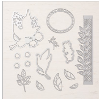
Wonderful Floral Framelits Dies