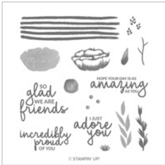
Incredible Like You Photopolymer Stamp