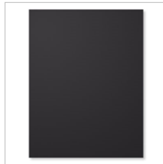
Basic Black 8-1/2" X 11" Cardstock